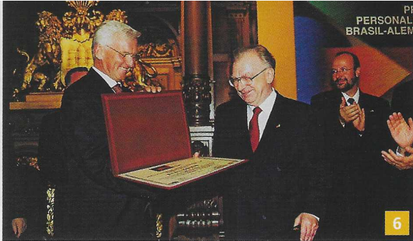
6. Lothar Späth empfängt die Urkunde aus den Händen von AHK-Präsident Ben van Schaik