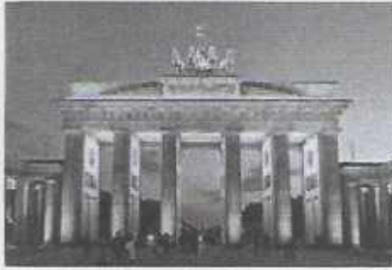
Das Brandenburger Tor mit Quadriga in Berlin, Wahrzeichen des wiedervereinigten Deutschlands

Die deutsche Wiedervereinigung oder deutsche Vereinigung [1] (in der Gesetzessprache Herstellung der Einheit Deutschlands ) [2] war der durch die friedliche Revolution in der DDR angestoßene Prozess der Jahre 1989 und 1990, der zum Beitritt der Deutschen Demokratischen Republik zur Bundesrepublik Deutschland am 3. Oktober 1990 führte. Die damit vollzogene deutsche Einheit, die seither an jedem 3. Oktober als Nationalfeiertag mit dem Namen Tag der Deutschen Einheit begangen wird, beendete den als Folge des Zweiten Weltkrieges in der Ära des Kalten Krieges vier Jahrzehnte währenden Zustand der deutschen Teilung .