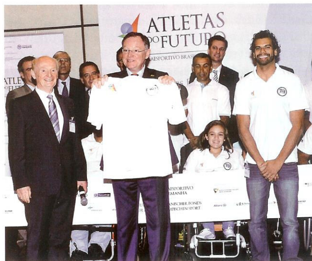
Stephan Weil (ao centro), governador da Baixa Saxônia, na apresentação da iniciativa em São Paulo

Para os anos de 2015 e 2016, está prevista a ampliação do escopo da iniciativa, além da sequência do projeto de capacitação e inclusão profissional, com a busca de mais benefícios aos atletas. •